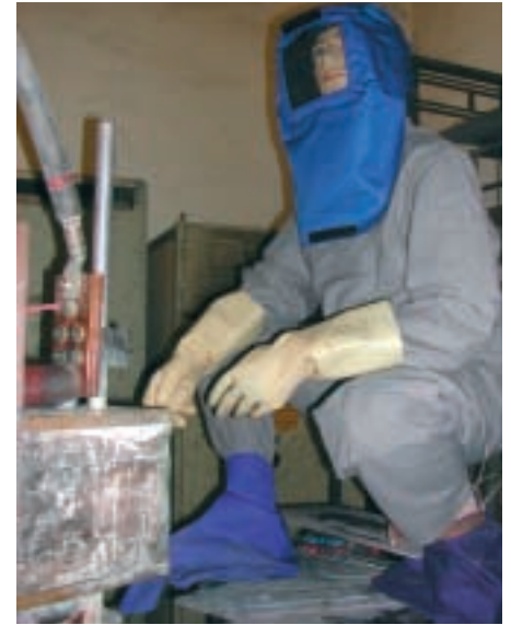
Versuchsaufbau für Arbeiten am KVS im Prüflabor der Universität Ilmenau zusammen mit dem Sächsischen Textil Forschungsinstitut in Chemnitz (Wärme-sensor im Knie)

Maßgebend für die freigesetzte Energie bei einem Kurzschlusslichtbogen ist die Größe des Kurzschlussstromes und die Kurz-